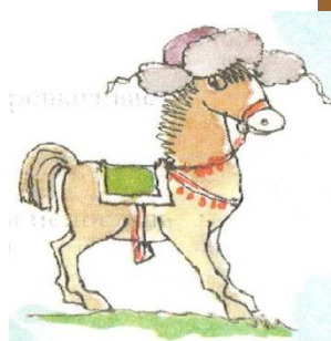
ло ш адке в ш апке