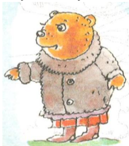
ми ш утка в ш убке