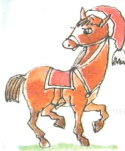
ло ш адке в ш апке