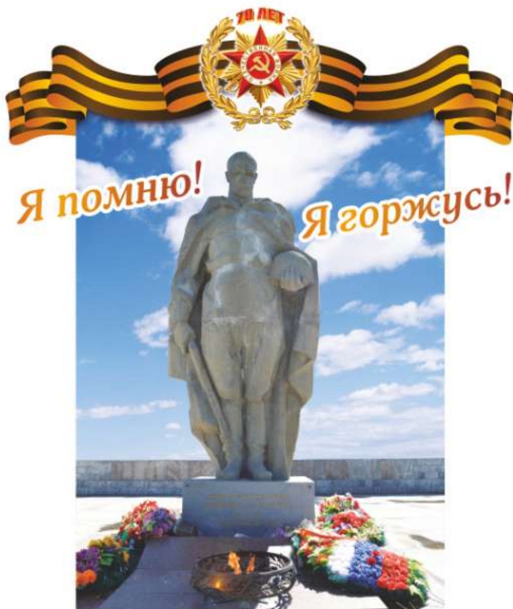
Памятники и памятные знаки воинам Великой Отечественной войны, расположенные на территории Полевского городского округа